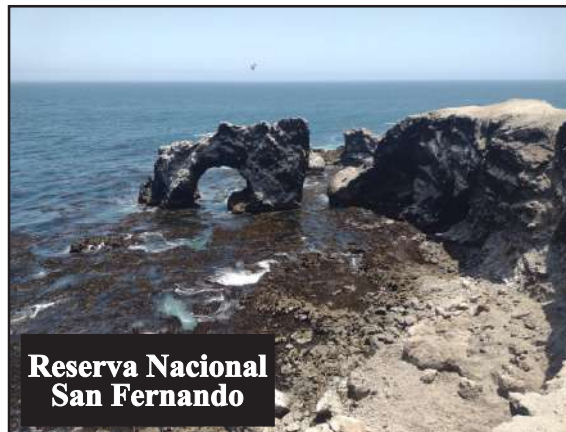
Reserva Nacional San Fernando

La Reserva Nacional Tambopata, ubicada en Madre de Dios, es un paraíso de biodiversidad con ecosistemas que albergan guacamayos, lobos de río y numerosas especies de fauna. Su atractivo más visitado es el Lago Sandoval, donde los turistas pueden recorrer senderos y observar la