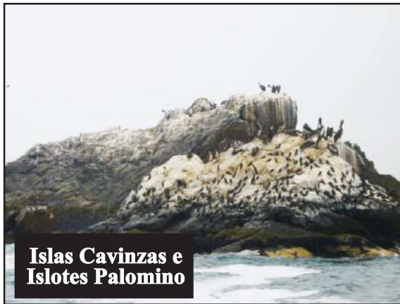
Islas Cavinzas e Islotes Palomino

riqueza natural de la selva. Además, cuenta con un sendero elevado de madera de 2.8 km, siendo amigable para visitantes con alguna discapacidad y familias con niños pequeños. En Ica se encuentra la Reserva Nacional San Fernando, un refugio marino-costero que combina desierto, acantilados y humedales. Su biodiversidad incluye lobos marinos, pingüinos, guanacos y cóndores, convirtiéndolo en un corredor biológico único en el país. La ensenada de San Fernando, rodeada de formaciones rocosas y playas vírgenes, se posiciona como uno de sus principales atractivos.