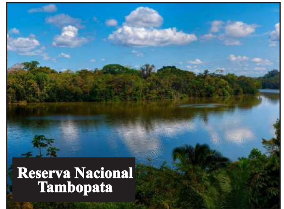
Reserva Nacional Tambopata

Finalmente, están las Islas Cavinzas e Islotes Palomino. Situadas en el Callao, forman parte de la Reserva Nacional Sistema de Islas, Islotes y Puntas Guaneras. Este destino es famoso por su colonia de lobos marinos, donde los visitantes pueden nadar con ellos en zonas delimitadas. Asimismo, es hogar de pingüinos de Humboldt y aves como piqueros y guanay.